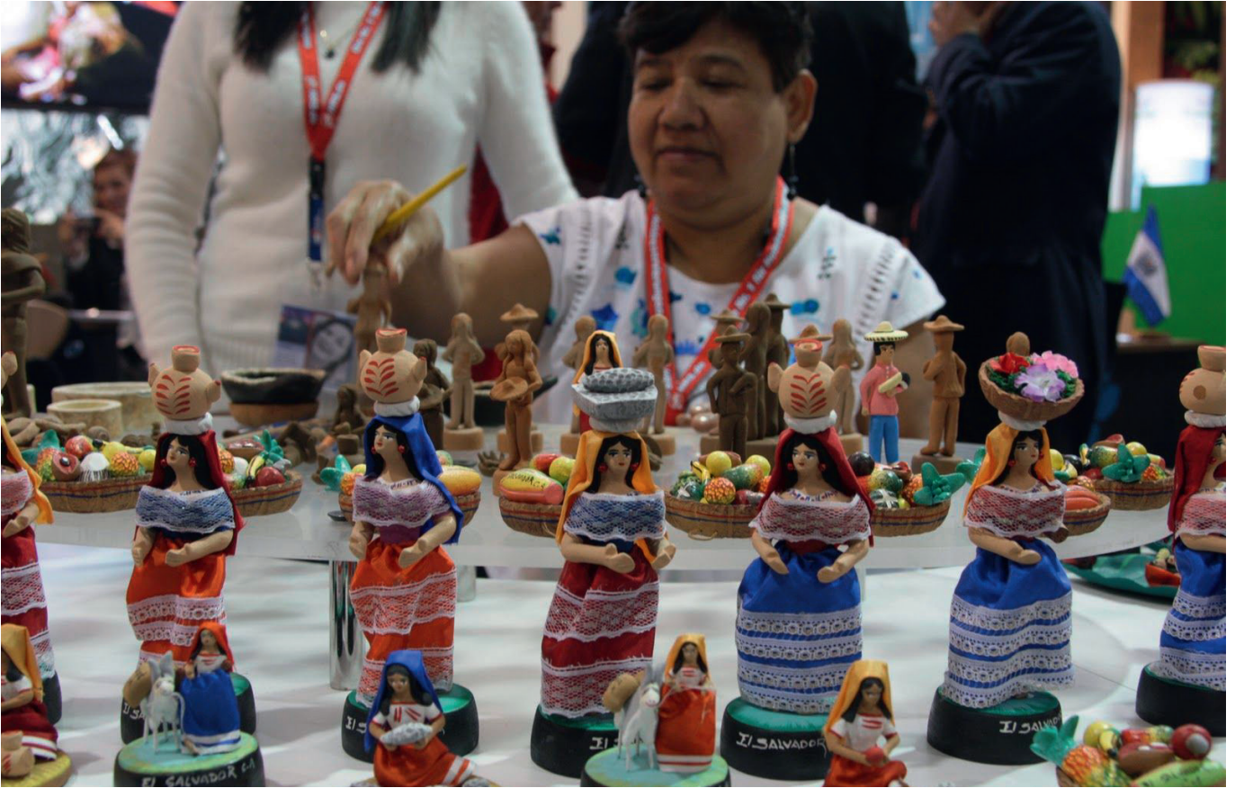
▲ Miniaturen aus Ilobasco