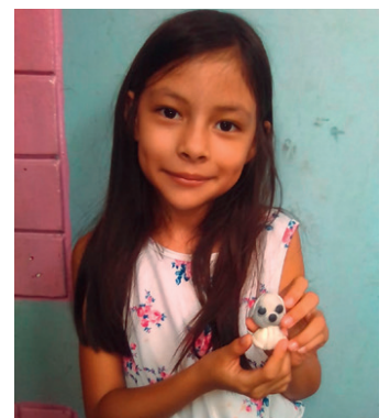
► Miniaturen à la Funda