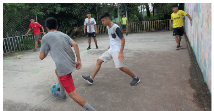
▲ In La Funda wird wieder Fussball gespielt!

◆ Der Lockdown in El Salvador ist aufgehoben, jedoch beeinflussen die bestehenden Massnahmen den Alltag immer noch stark. Neben der Maskentragpflicht werden in Shoppingcentern beim Betreten die Körpertemperatur gemessen und die Schuhsohlen mit Chlor desinfiziert. Busse dürfen offiziell nur bis zu 35% der Kapazität gefüllt werden. Das ist zwar gut gemeint, aber nicht umsetzbar. Zu den Stosszeiten sind sie übervoll wie eh und je. Das Notspital auf dem Messegelände in der Hauptstadt mit bis zu 1000 Betten steht beinahe mit der vollen Kapazität bereit. Die Schulen bleiben bis mindestens im Januar 2021 geschlossen und jede institutionelle Arbeit mit Gruppen ist untersagt. Das Team von La Funda ist täglich im Quartierzentrum und hat ihr Angebot an online-Unterricht und -Kursen fleissig ausgebaut. Möglich ist die Beratung von Einzelpersonen und Sport auf dem Spielfeld, – beides wird sehr gerne und rege genutzt.